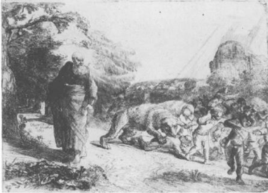
Constantijn van Renesse, Elisa vervloekt de spottende kinderen, gravure, 1653. Rijksprentenkabinet, Amsterdam.

Te bespreken tekst is vs 19-25!! Dus dit vooral lezen. Ik geef voor de context ook eerste gedeelte van hfst 2Kon2 weer. Voor de fijnproevers.