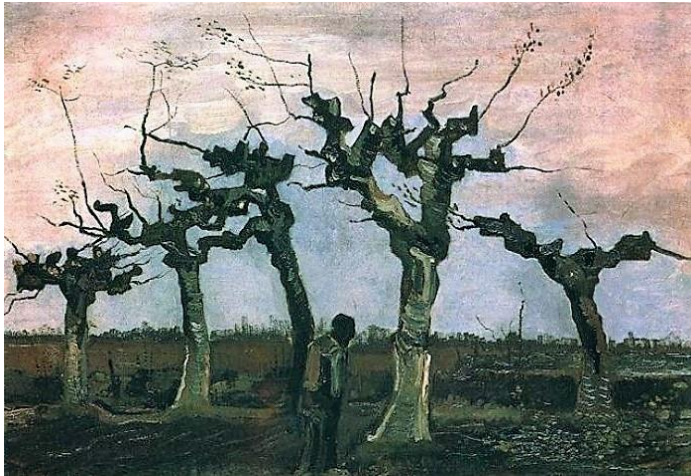
Vincent van Gogh: Landschap met knotwilgen (1884)